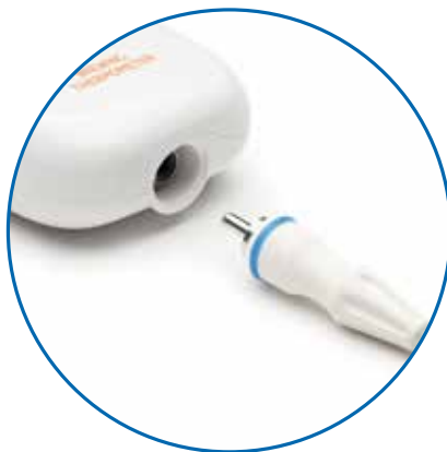
Sonde de température interchangeable