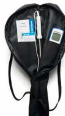
HI935012 est fourni avec une housse de transport souple

HI710026 Étui antichoc bleu HI762-18C Clé de test à -18 °C HI762000C Clé de test à 0 °C HI762070C Clé de test à +70 °C