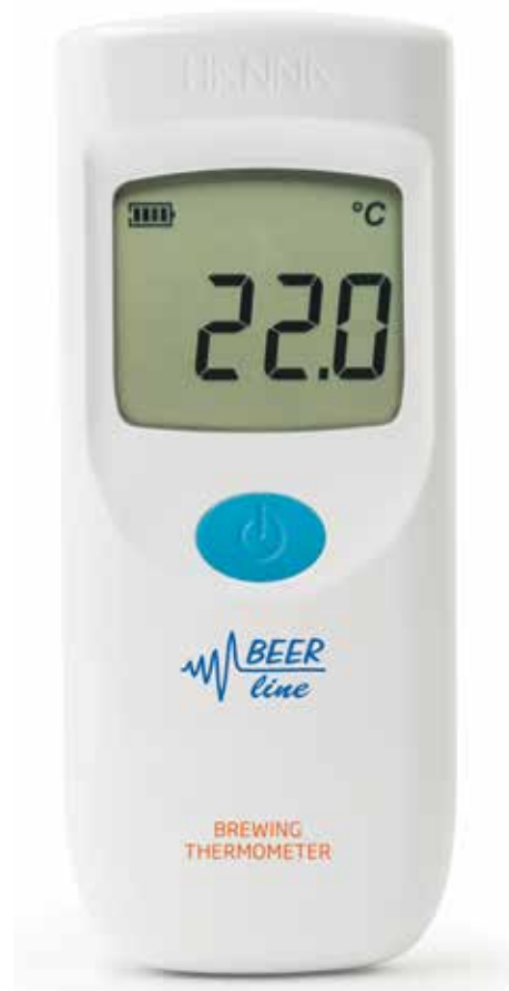
Compatible toutes sondes de température à thermistance